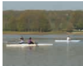
Le club Aviron au lac du Bourdon

Demandez le règlement de participation et des renseignements au 06 84 35 81 36 ou aviron.fargeaulais@free.fr