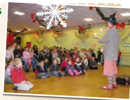
Photo du Noël des enfants en 2009.

Le lundi 20 décembre à 15h aura lieu le spectacle de Noël des enfants à la salle des sports de Saint-Fargeau suivi du traditionnel goûter. Les enfants pourront à cette occasion réaliser un dessin qui sera ensuite exposé dans une vitrine d'un commerçant qui remettra alors un cadeau à l'enfant qui viendra chercher son dessin.